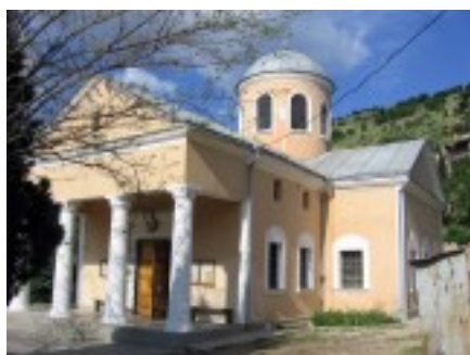
Храм святых Двенадцати Апостолов.

Мыс Айя – обрывистая западная оконечность Южного берега Крыма, удаленная от основных дорог и проторенных троп туристов. К юго-западу от мыса Айя простирается территория государственного ландшафтного заказника "Мыс Айя". Вот почему здесь сохраняется первозданность и нетронутость удивительной природы. Цивилизованный человек еще не добрался к заповедной тишине этих дубрав, не успел распилить на сувениры смолистые стволы тысячелетних можжевельников, вытоптать поляны с редчайшими орхидеями и пыльцеголовниками. И крымская "бесстыдница" земляничник мелкоплодный еще поражает наше воображение пышной зеленью своих крон. Нет-нет, да и увидишь переползающего горную тропу леопардового полоза, занесенного в Красную книгу Украины. А в прибрежных водах, погрузившись в их теплые объятия, еще можно обнаружить крабов, рапанов и мидий. Сапсаны, орлы, парящие в океане неба, огласят вдруг пронзительным свистом пространство, напоминая, что жизнь кипит не только среди залитых солнцем обрывов. Таков заповедник, государственный ландшафтный заказник "Мыс Айя".